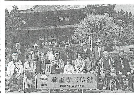
前期刊行の一期として訪れた世界遺産である日光東照宮、輪王寺にて。いにしえを偲びながら貴重な歴史を学びました。

官数名をお迎えして、約三時間に亘り実施指導して頂きます。又受講終了者は消防総監名の認定書を発給します。