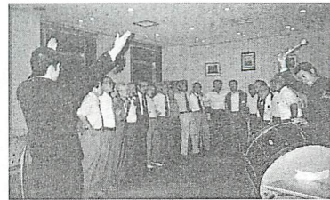
肩を組み、法大応援団のリードで校歌を高らかに斉唱し、学生時代にタイムスリップしたかのような様子が、学生時代にタイムスリップしたかのような様子が、学生時代にタイムスリップしたかのような様子

1963年卒の法学部A組 昭和38(1963)年卒業会を催した。卒業後36年 業の法政大学法学部A組は、7月6日、母城市々々キ ンパスのホールで、1963年卒業会を催した。卒業後36年 業の法政大学法学部A組は、7月6日、母城市々々キ ンパスのホールで、1963年卒業会を催した。卒業後36年